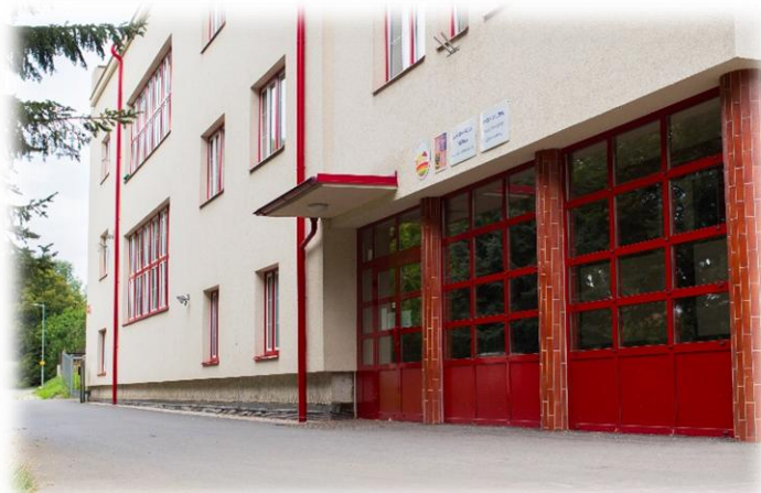
Budova na ulici Komenského

Výuka probíhá ve dvou budovách, a to na ulici Komenského a na ulici Tyršova. V krásném prostředí pod lesem Zárubou na ulici Komenského se dle kapacitních možností zpravidla učí žáci 1., 2. a 3. ročníku. Je zde umístěno až šest tříd a oddělení školní družiny.