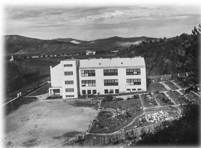
Budova na ulici Komenského, podzim 1932

Její historie sahá až do roku 1920, kdy byla zřízena Měšťanská smíšená škola v Kuřimi. Pro tuto školu byla v roce 1929 vystavěna nová budova na ulici Komenského. Na svou dobu byla tato budova opravdu velmi moderní – měla ústřední topení, velkou tělocvičnu, kuchyň s jídelnou, dílny, fyzikální a přírodovědnou učebnu, sprchy, umývárny, šatny i čítárnu pro žáky. Později se podařilo u školy založit okresní vzornou školní zahradu, kde nechyběly zavlažovací hydranty, jezírka a včelín.