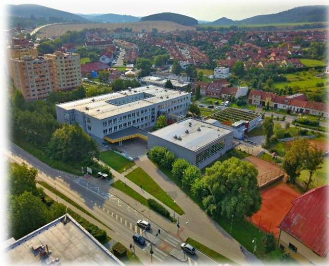
Budova na ulici Tyršova

velká a malá tělocvična, kinosál, školní knihovna, oddělení školní družiny a školní jídelna. Ve vnitrobloku se nachází nově zrekonstruované atrium sloužící jako komunitní zahrada i jako místo k odpočinku. K pohybovým aktivitám žáci využívají sportovní areál s hřištěm. V budově na ulici Tyršova se nachází také celé ředitelství školy a zázemí pro školní poradenské pracoviště. Obě budovy jsou bezbariérové (v budově na ulici Tyršova je výtah, na ulici Komenského schodolez) a obě jsou v blízkosti autobusového a vlakového nádraží. Vzdálenost mezi oběma budovami je přibližně 10 minut klidnou chůzí.